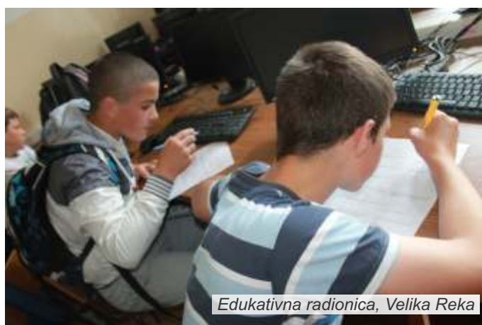
Edukativna radionica, Velika Reka