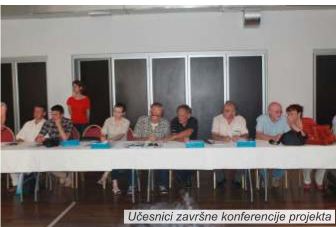
Učesnici završne konferencije projekta

situacije, mediji i svi članovi projektnog tima. Završna konferencija bila je posvećena dostupnim izvorima finansiranja u oblasti zaštite životne sredine i upravljanja rizicima od prirodnog hazarda, institucionalizaciji mreže NVO u regionu i prezentaciji projektnih rezultata sa akcentom na budućim akcijama.