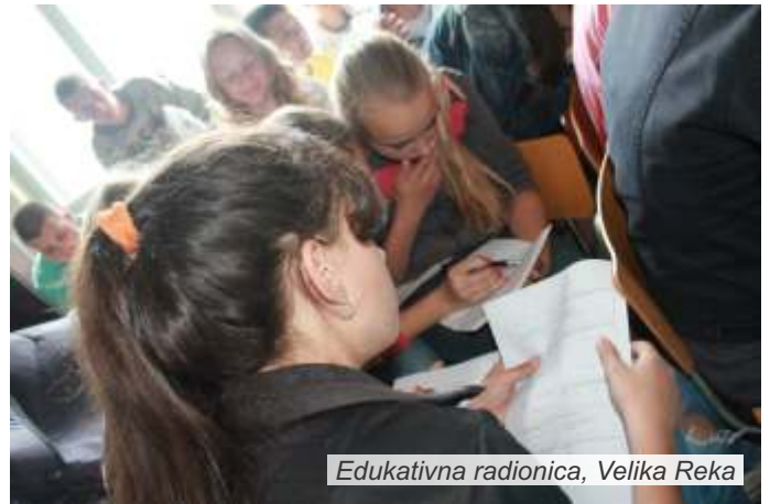
Edukativna radionica, Velika Reka

Cilj edukativne kampanje kojom je obuhvaćeno oko 400 učenika u pet osnovnih škola u Podrinju je podizanje svesti dece o pitanjima koja se tiču životne sredine.