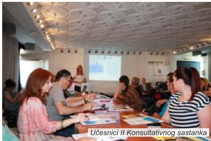
Učesnici II Konsultativnog sastanka

Konstatovano je da na lokalnom nivou nema dovoljno materijalnih i kadrovskih kapaciteta za upravljanje rizicima od elementarnih nepogoda i da je za efikasno delovanje u ovoj oblasti