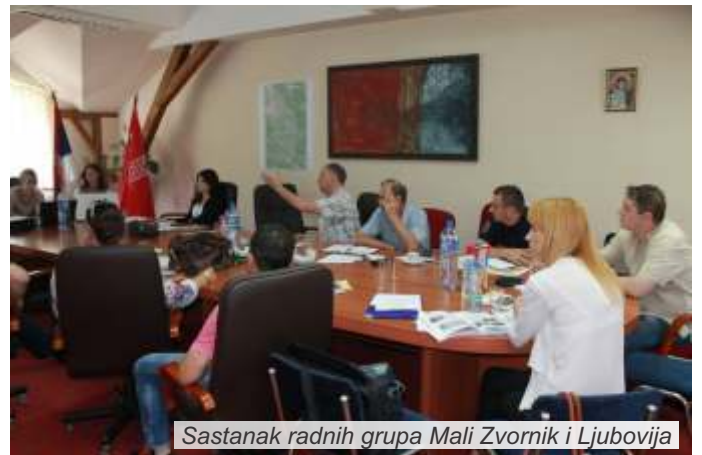
Sastanak radnih grupa Mali Zvornik i Ljubovija

Plan upravljanja rizikom od prirodnog hazarda za opštine Mali Zvornik i Ljubovija izrađen je u okviru projekta „Dijalog za prevenciju prirodnog hazarda“. Dokument sadrži detaljnu analizu stanja na terenu u obe opštine u pogledu ugroženosti od prirodnog hazarda, ocenu ranjivosti i predloge mera za prevenciju rizika. Izrađen je po principu participativnog pristupa, uz učešće predstavnika opština, javnih preduzeća, civilnog sektora i drugih zainteresovanih strana, koji su u izradi dokumenta učestvovali kroz članstvo i rad u radnim grupama.