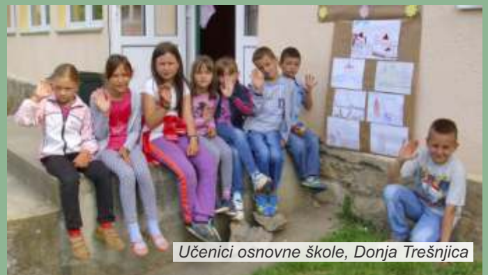
Učenici osnovne škole, Donja Trešnjica