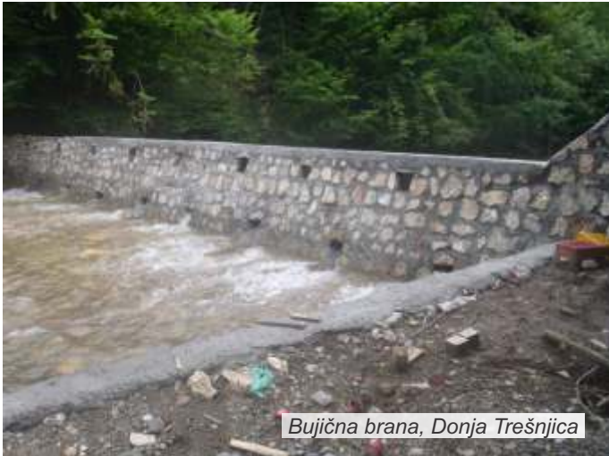
Bujična brana, Donja Trešnjica

On je naglasio da će ove godine u prevenciju biti uloženo 70 miliona evra, što je ukupna vrednost svih projekata koji će početi da se realizuju, a u koje, kako je dodao, spadaju strukturne i nestrukturne mere kao i izgradnja potpuno novih infrastrukturnih objekata na teritoriji više opština u Srbiji.