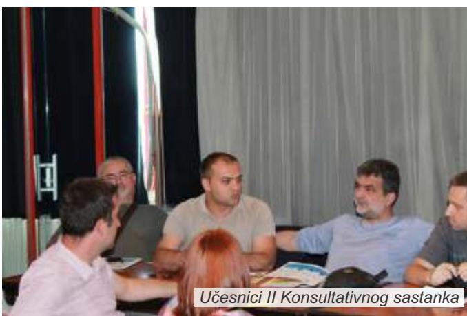
Učesnici II Konsultativnog sastanka

Zaključci definisani na ovim sastancima biće u najkraćem roku prosleđeni Ministarstvu poljoprivrede i zaštite životne sredine Republike Srbije, Ministarstvu javne uprave i lokalne samouprave Republike Srbije, Ministarstvu unutrašnjih poslova Republike Srbije, Kancelariji za pomoć poplavljenim područjima, Skupštinama opština u regionu Podrinja, Kancelariji Vlade Srbije za saradnju sa civilnim društvom, Privrednoj Komori Srbije, Regionalnom centru za životnu sredinu, Beograd i Švedskoj razvojnoj agenciji – SIDA, koja je finansijski podržala sprovođenje konsultativnog procesa i