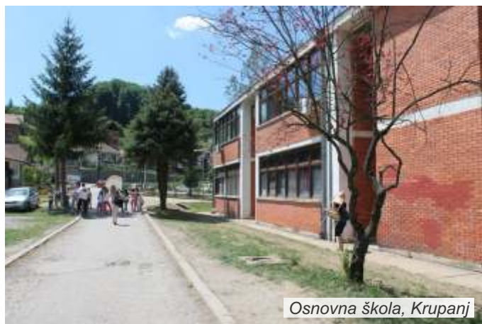
Osnovna škola, Krupanj

Učenicima je na slikovit način, uz pomoć zanimljivih video materijala, prezentovana pojava klimatskih promena i prirodnog hazarda i njihova međusobna veza. Osim o klimatskim promenama i prirodnom hazardu, na radionicama bilo je reči i o mogućnostima smanjenja zagađenja i emisije štetnih gasova, kao važnih preduslova za ublažavanje klimatskih promena. Anonimne ankete