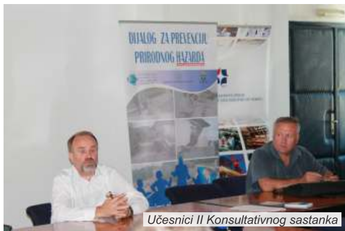
Učesnici II Konsultativnog sastanka

Drugi konsultativni sastanak, održan u okviru Komponente 3 SENSE programa – Dijalog i umrežavanje, koji sprovodi Regionalni centar za životnu sredinu (REC), a realizuju Unija ekologa UNEKO, Omladinsko udruženje „Naša Ljubovija“ i „Eko Drina“ Mali Zvornik, završen je uz snažnu poruku da „ono što bacamo u reku već sutra reka može doneti pred naša vrata“ i poziv na odgovornost i odricanje od egoizma i sebičnosti.