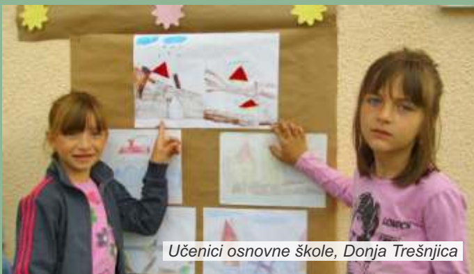
Učenici osnovne škole, Donja Trešnjica

čas na otvorenom, ispred škole, a deca su na simboličan način podsetila na nedaće koje su im obeležile jedan period detinjstva, tako što su komšijama odneli crteže sa cvećem i porukom „Da se ne ponovi“.