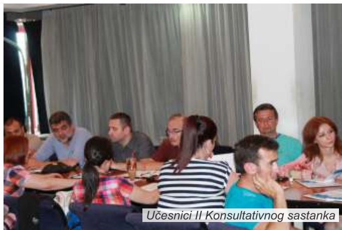
Učesnici II Konsultativnog sastanka

podsetio na reči Marka Blagojevića, direktora Kancelarije za obnovu i pomoć poplavljenim područjima, da su džaba sve investicije ukoliko nove kuće i obnovljenu infrastrukturu ostavljamo pod rizikom od nepogoda.