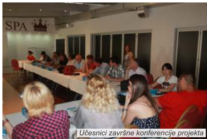
Učesnici završne konferencije projekta

Konferenciji su prisustvovali predstavnici opština Mali Zvornik, Ljubovija i Loznica, predstavnici nevladinih organizacija iz Podrinja, predstavnici sektora za vanredne