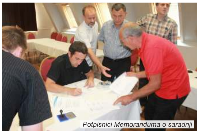
Potpisnici Memoranduma o saradnji

unapređenja i zaštite životne sredine, primene načela i principa održivog razvoja, zaštiti i održivom korišćenju prirodnih resursa, unapređenju dostupnosti informacija od javnog značaja, jačanju lokalne zajednice za adaptivni odgovor na klimatske promene.