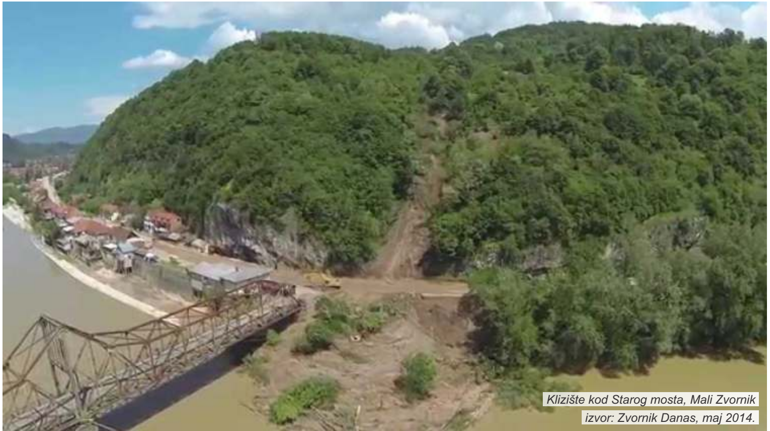
Klizište kod Starog mosta, Mali Zvornik

Projekat „Dijalog za prevenciju prirodnog hazarda“ realizuje se na području opština Mali Zvornik i Ljubovija. Projekat sprovodi Unija ekologa „Uneco“ iz Beograda u saradnji sa Udruženjem građana „Eko Drina“ iz Malog Zvornika i Omladinsko ekološkim udruženjem „Naša Ljubovija“ iz Ljubovije preko SENSE programa podrške organizacijama civilnog društva u oblasti životne sredine u Srbiji, koji realizuje Regionalni centar za životnu sredinu (REC). Program finansira Švedska agencija za međunarodni razvoj i saradnju (SIDA). Projekat traje deset meseci (avgust 2014 – jun 2015).