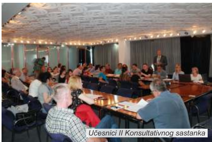
Učesnici II Konsultativnog sastanka

D rugi konsultativni sastanak u okviru projekta „Dijalog za prevenciju prirodnog hazarda“, posvećen jačanju otpornosti lokalnih zajednica na elementarne nepogode i aktivnoj ulozi lokalnih zajednica u upravljanju rizicima od prirodnog hazarda, održan je 1. juna u Privrednoj komori Srbije u Beogradu. Na sastaku, koji je okupio predstavnike civilnog sektora i opština u Podrinju i predstavnike relevantnih nacionalnih institucija, definisani su konačni zaključci i preporuke koji nadležnima u Republici Srbiji treba da pomognu da bolje sagledaju nedostatke i potrebe na lokalnom nivou i u skladu s tim kreiraju kvalitetna sistemski rešenja u oblasti upravljanja rizicima od elementarnih nepogoda.