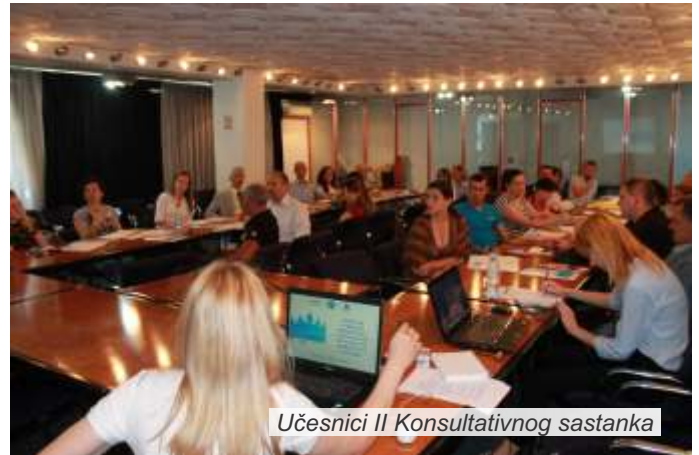
Učesnici II Konsultativnog sastanka

Jedan deo definisanih zaključaka plod su prvog konsultativnog sastanka održanog na lokalnom nivou, za predstavnike civilnog sektora i opština u Podrinju, 05. marta u Banji Koviljači, na temu „Upravljanje rizicima od prirodnog hazarda na lokalnom nivou u regionu Podrinja“, u okviru komponente 2 SENSE programa – Dijalog i umrežavanje.