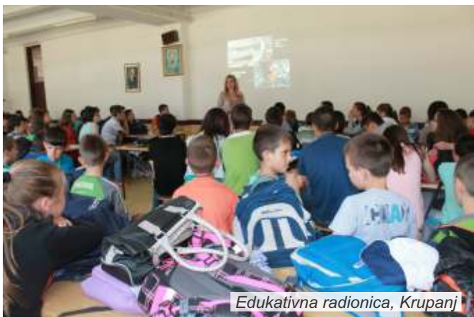
Edukativna radionica, Krupanj

odlučivanju o pitanjima zaštite životne sredine i pravnoj zaštiti kada su prethodna dva prava narušena. Edukatori su interesantnom prezentacijom uspeali da učenicima približe i pojasne ovu, naizgled, tešku temu, pa su rezultati ankete o usvojenom znanju na kraju radionice takođe bili veoma dobri.