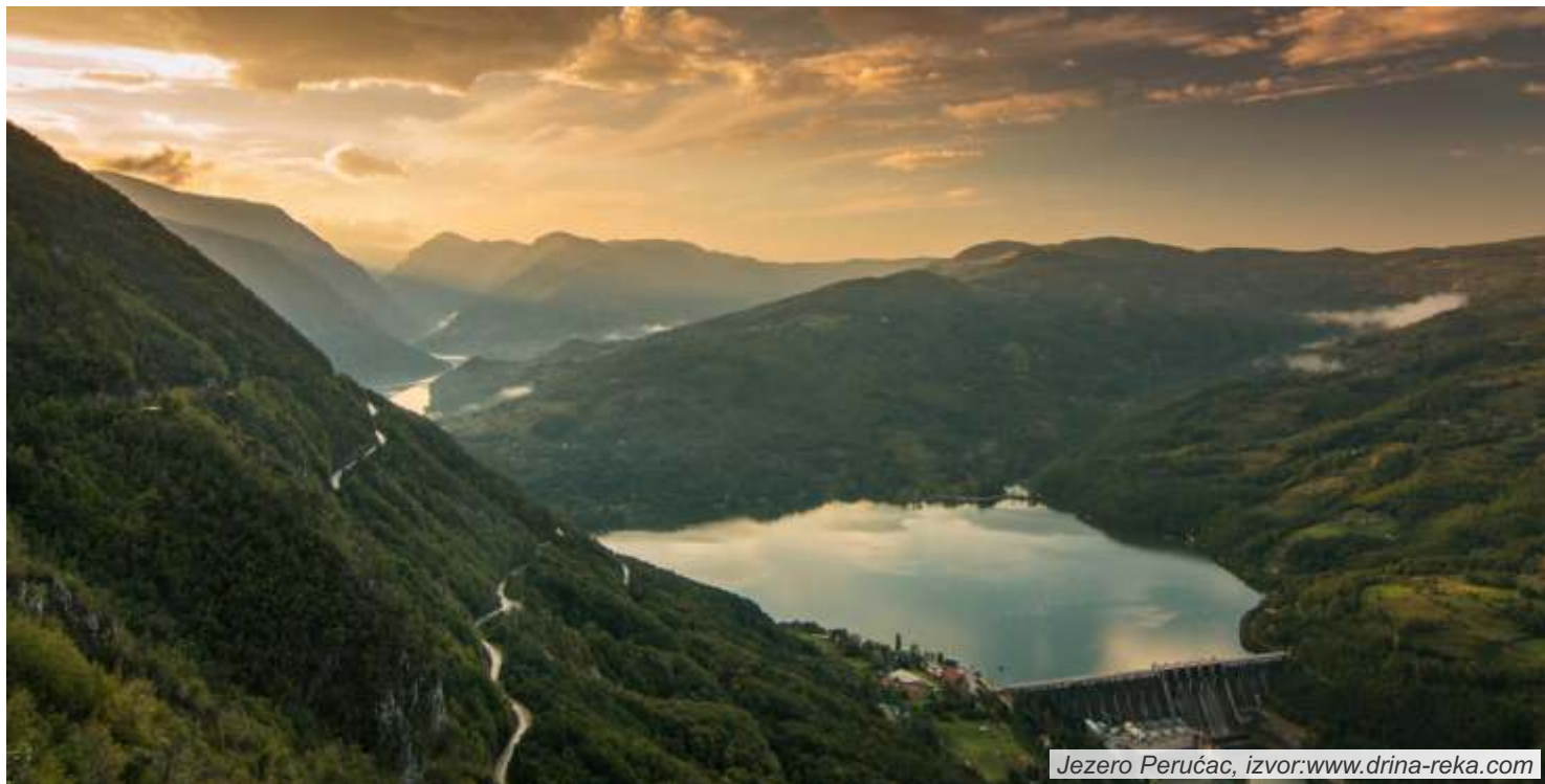
Jezero Perućac, izvor:www.drina-reka.com

Projekat “Dijalog za prevenciju prirodnog hazarda” izabran je u drugom krugu dodele grantova za projekte organizacija civilnog društva u Srbiji koji je sproveo Regionalni centar za životnu sredinu za Centralnu i Istočnu Evropu (REC), Kancelarija u Srbiji, uz podršku Švedske agencije za međunarodni razvoj i saradnju (SIDA).