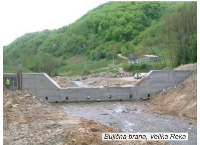
Bujična brana, Velika Reka