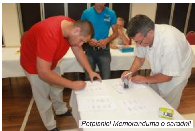
Potpisnici Memoranduma o saradnji