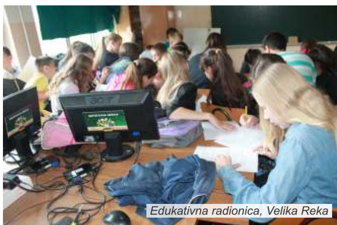
Edukativna radionica, Velika Reka

Posle uspešno održanih radionica o klimatskim promenama i prirodnom hazardu, za učenike u Malom Zvorniku krajem maja održana je i radionica na temu „Imam pravo da znam“, posvećena Arhuskoj konvenciji, odnosno pravu građana na informisanje o pitanjima koja se tiču životne sredine, učešću javnosti u