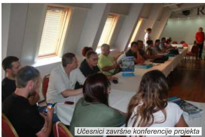
Učesnici završne konferencije projekta

situacije, mediji i svi članovi projektnog tima. Završna konferencija bila je posvećena dostupnim izvorima finansiranja u oblasti zaštite životne sredine i upravljanja rizicima od prirodnog hazarda, institucionalizaciji mreže NVO u regionu i prezentaciji projektnih rezultata sa akcentom na budućim akcijama.